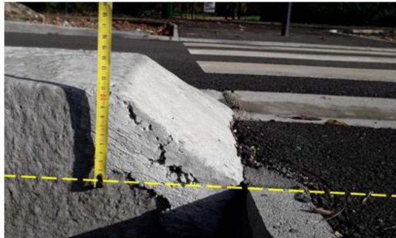
rue Général Mangin ( voie routière ) : hauteur 10 cm