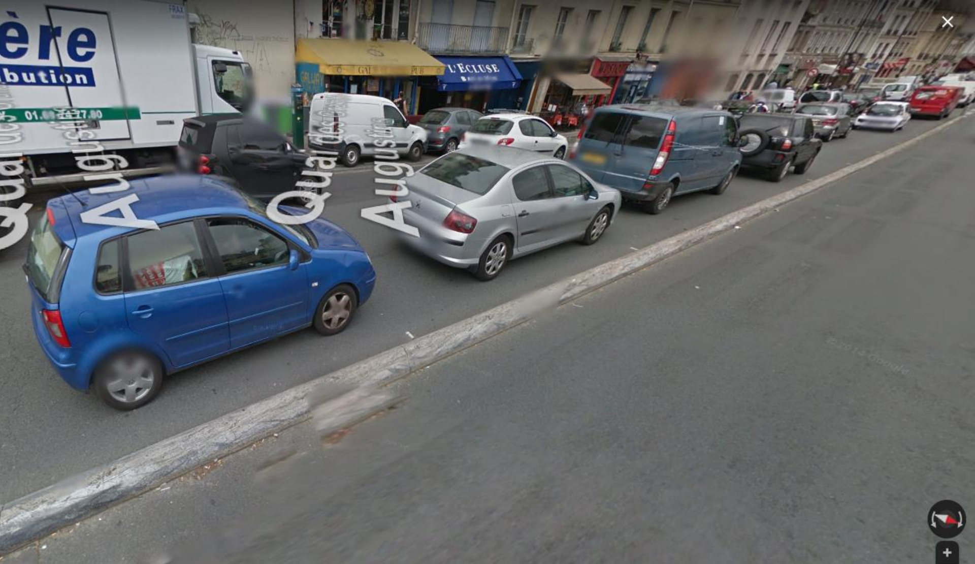
l'ancienne bordure sur le quai des Grands Augustins, Paris