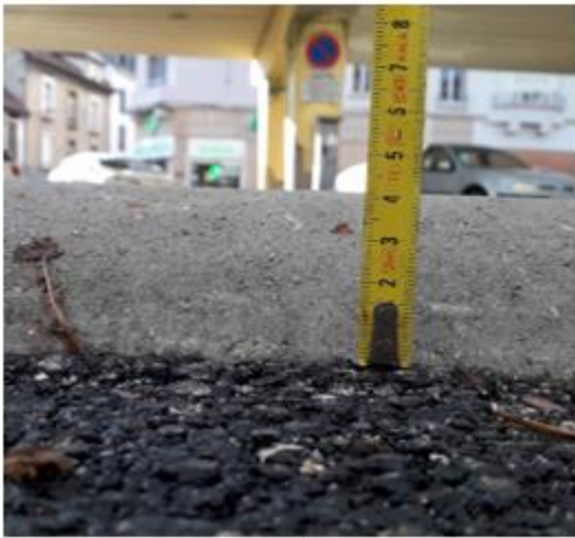
rue Joseph Rey : hauteur 4 cm