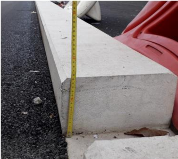
cours Berriat : hauteur record de 15 cm