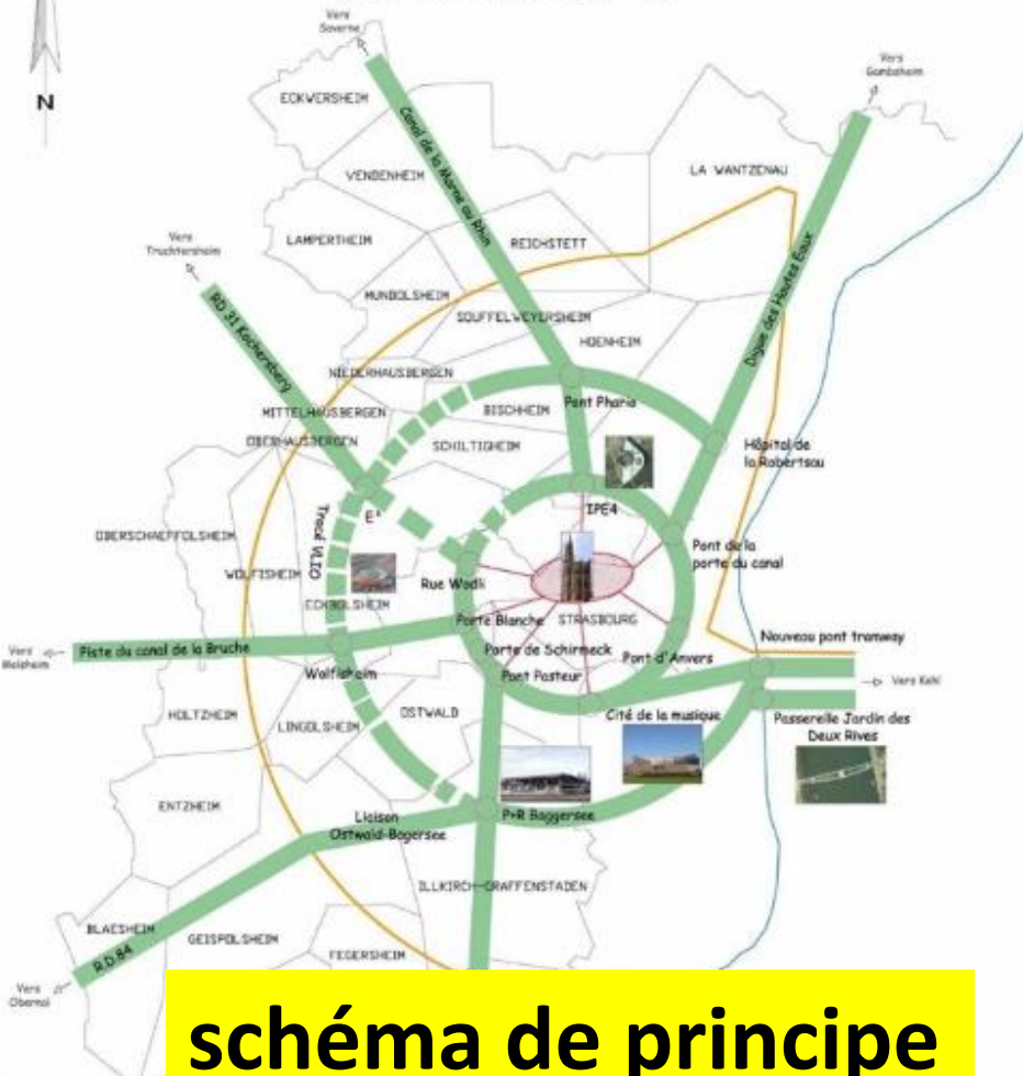
schéma de principe