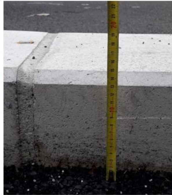
cours Lafontaine : hauteur record de 15 cm