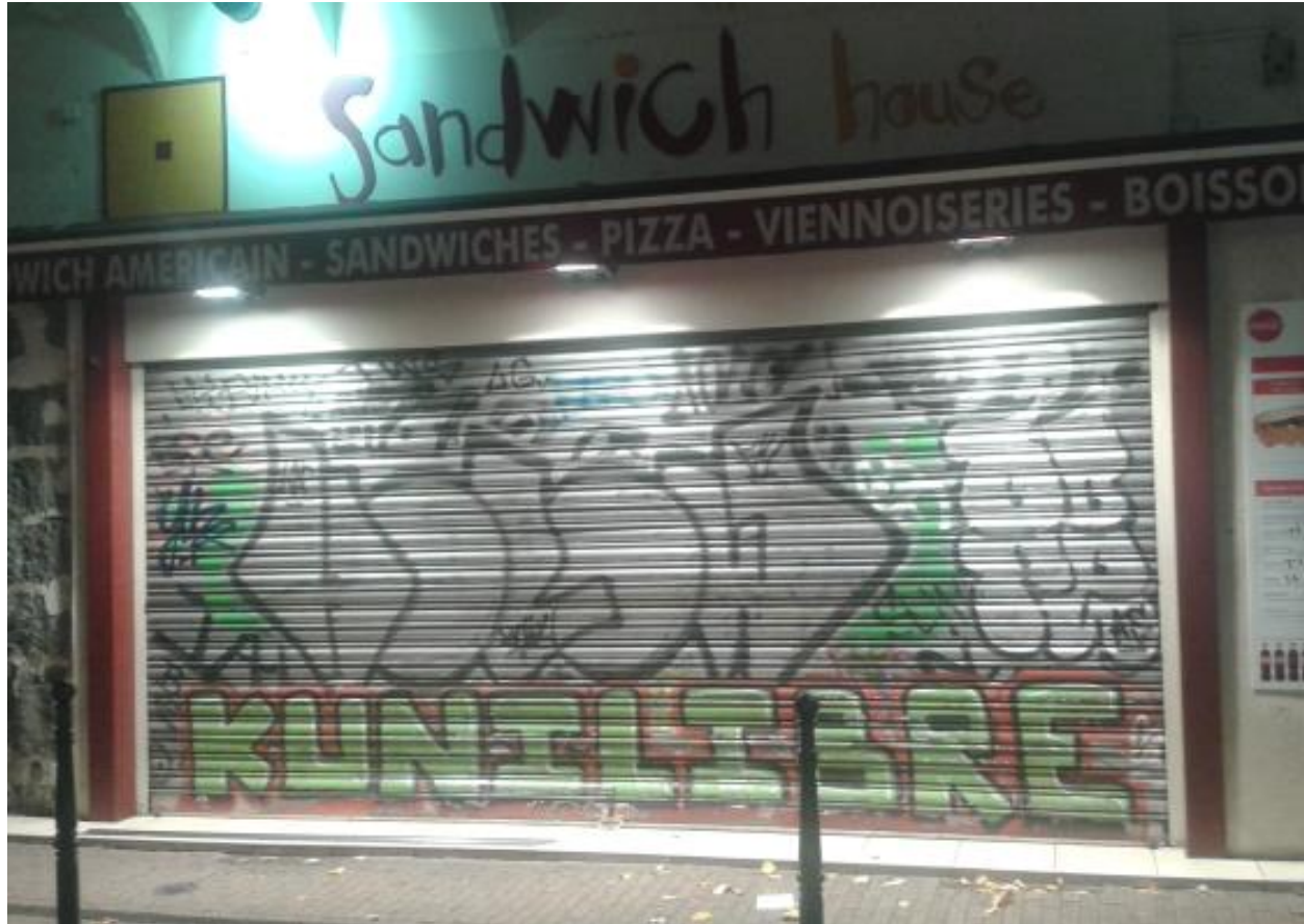
rideau tagué, station tramway Hubert Dubedout