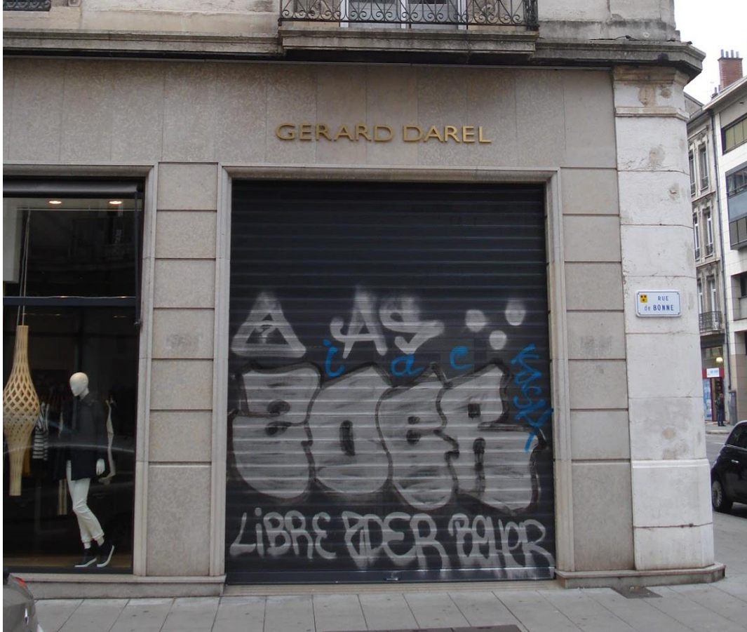
Magasin de vêtements féminins, rue de Bonne