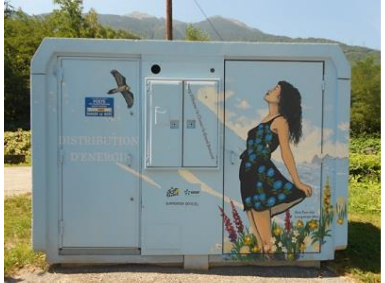
Transfo EDF, vers Albertville réalisé par rocodesud.com