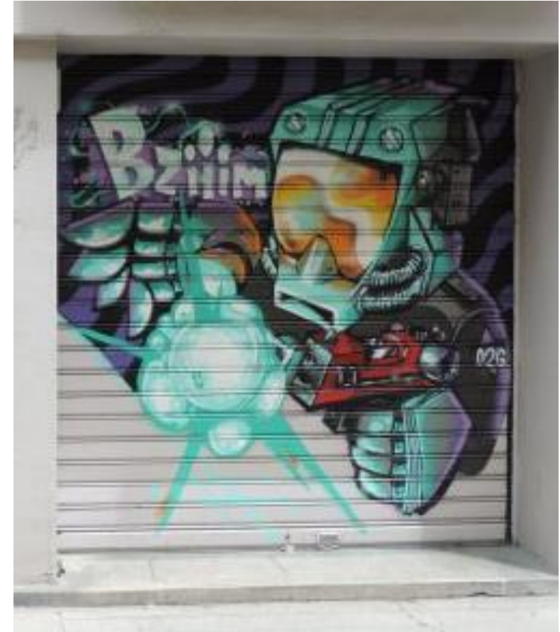
Contre exemple agressif rue Génissieu réalisé par : street art fest 2016