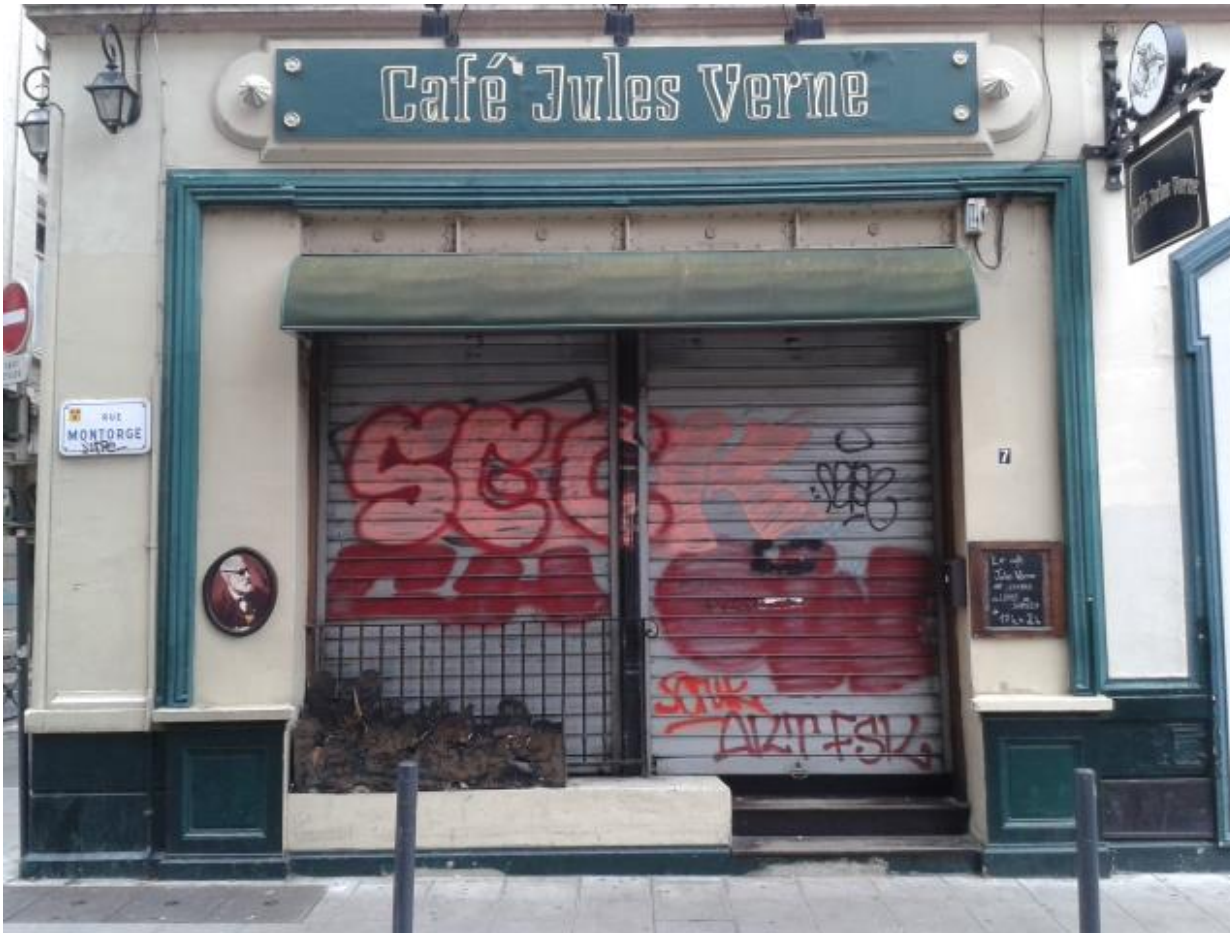
Café Jules Verne, rue Montorge