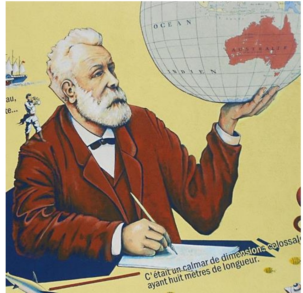
École Jules Verne, Pont de Claix réalisé par rocaledesud.com