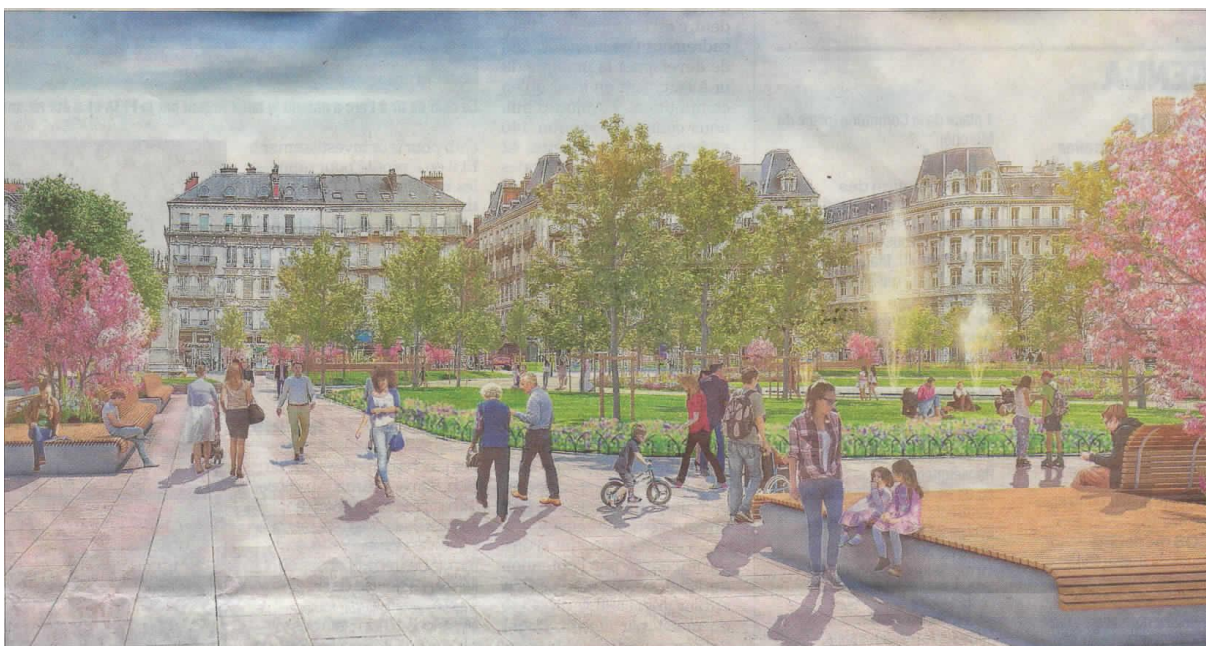
Voilà à quoi devrait ressembler la place Victor-Hugo fin 2019. Images Ville de Grenoble et photo Le D.U.S.H.