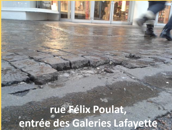
rue Félix Poulat, entrée des Galeries Lafayette