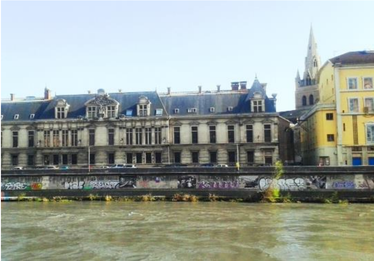
Le parlement du Dauphiné, l'Isère, le Théâtre, l'Eglise Saint-André