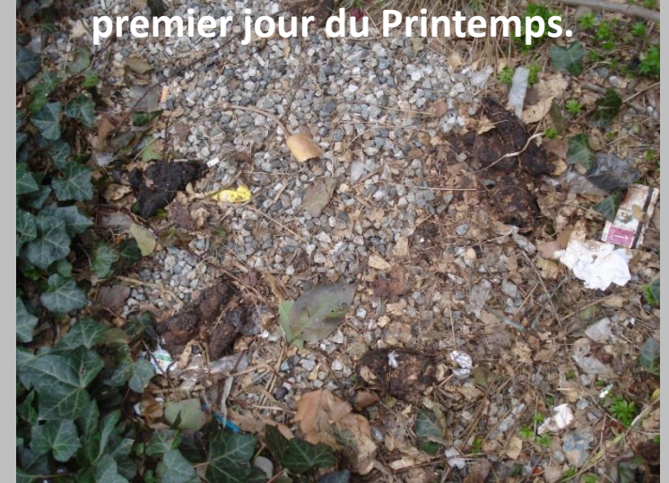
premier jour du Printemps.