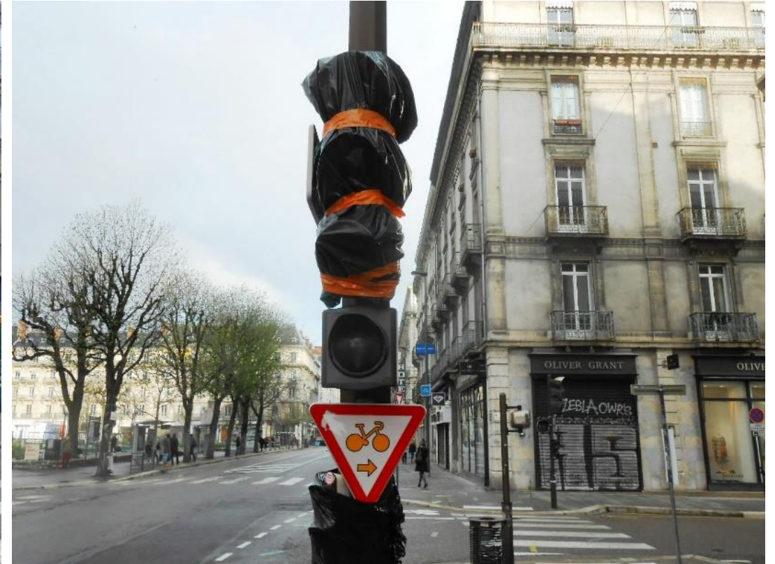
Bd Agutte Sembat