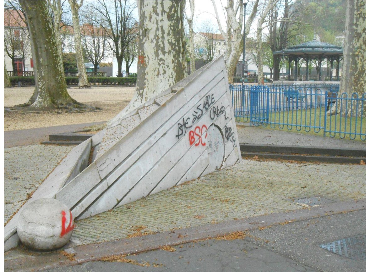
La fontaine du Torrent