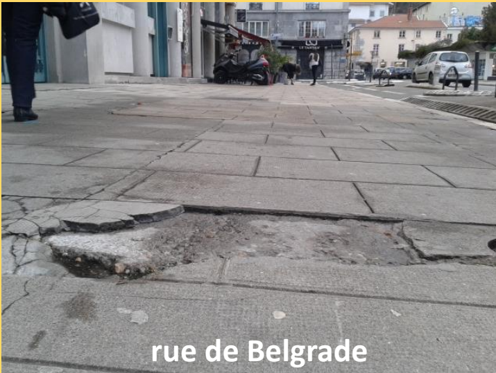
rue de Belgrade