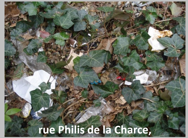
rue Philis de la Charce,