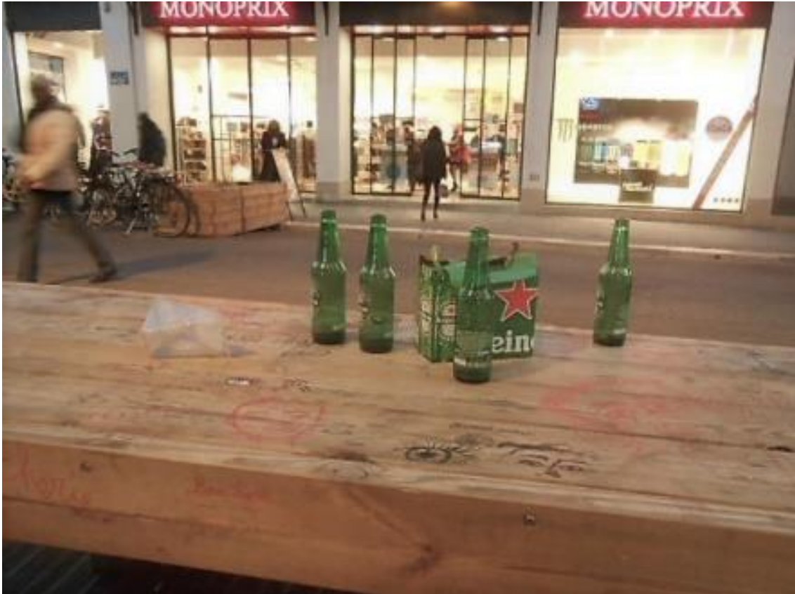
rue de la République