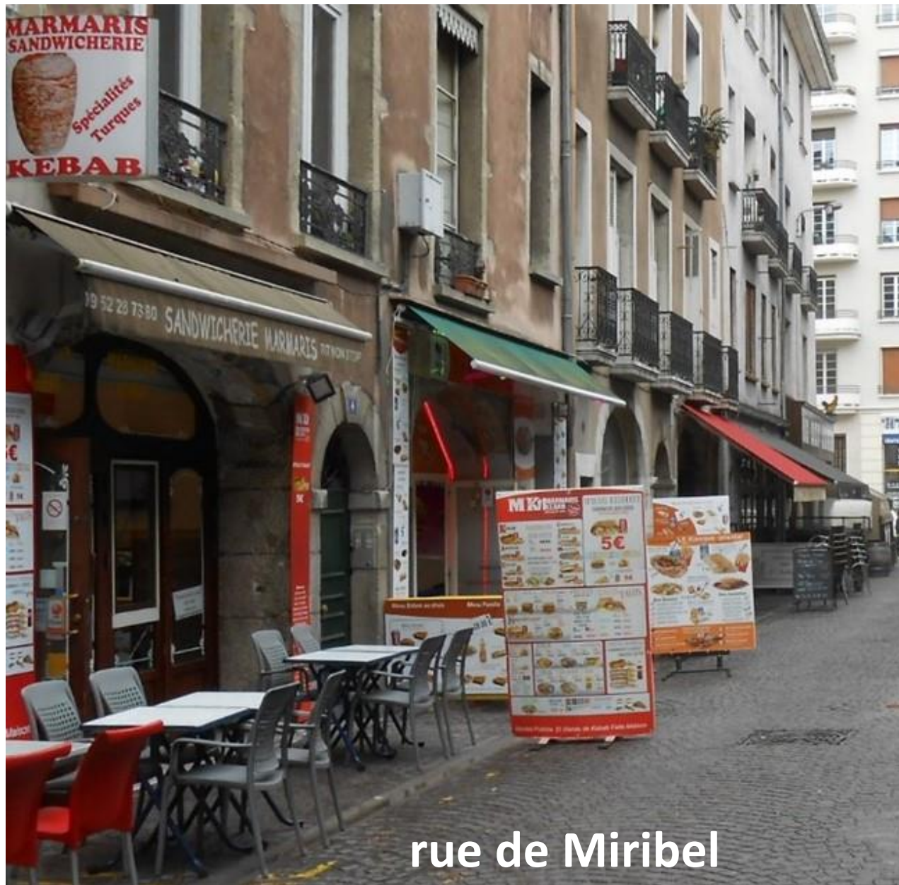
rue de Miribel