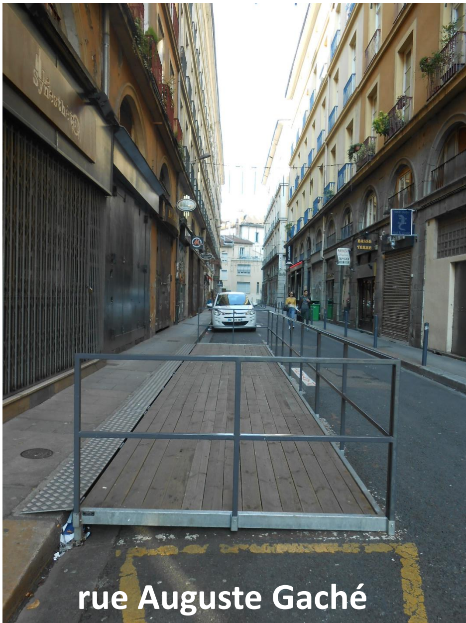
rue Auguste Gaché